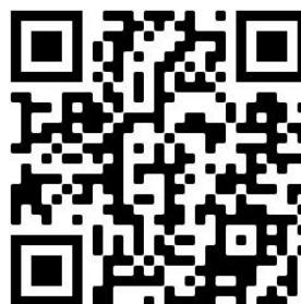
Figura 2 – QR Code do vídeo do projeto “Tours de Danse”

Esses momentos e esse amor, que, graças ao vídeo de Daniella, ficam registrados aqui 23 .